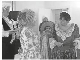
Reise nach Wien

Eintritt 25 Franken Reservation: 062 874 30 12 / reservation@kultschuer.ch