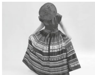
Karola Kauffmann

Im Zentrum des Ereignisses stehen die handgewebten Werke der Textilkünstlerin Karola Kauffmann. Ihre experimentellen Gewebe sind weit mehr als blosser Stoff: In Struktur und Farbe schlagen sie eine Brücke von der Vergangenheit in die Zukunft – von der statischen Kunst zur bewegten Performance. In dem Défilé werden diese Kunstwerke – gefertigt aus edlen Naturfasern und unkonventionellen Materialien – Teil einer bewegten Inszenierung.