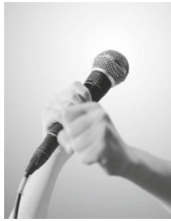
Open Mic Laufenburg

Reservieren an 004162 874 3012 / reservation@kultschuer.ch Eintritt frei, Kollekte