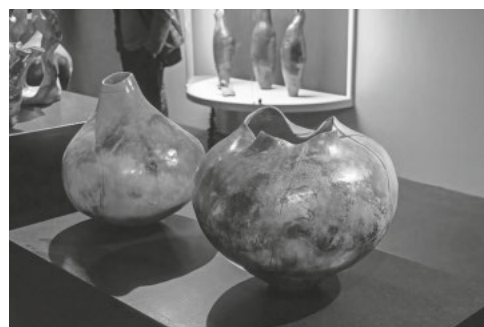
Arbeiten von Frauke Roloff in der Ausstellung Énergies fossiles