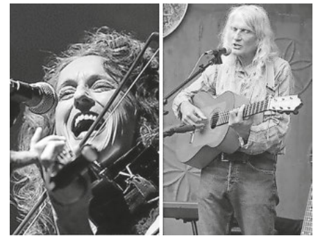
zwei Musiklegenden in Laufenburg

Reservation: 004162 874 3012 / reservation@kultschuer.ch