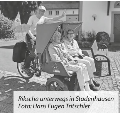
Rikscha unterwegs in Stadenhausen

Übrigens: Hin- und Rückfahrten zu unseren Veranstaltungen sind für Sie unentgeltlich.