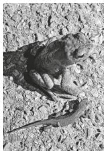
Amphibien auf der Wanderung

Bitte sendet uns eine WhatsApp oder ruft gerne ab 18:00Uhr an; unter: 0173 / 56 323 56 oder 0173 25 127 84 Abt. Naturschutz: Lars und Karina