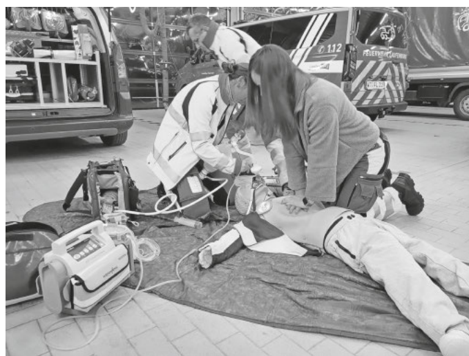
Akteure der First Responder beim Training am Übungsabend

Förderverein First Responder Laufenburg - Murg e.V.