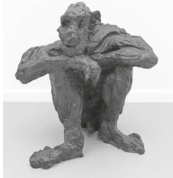
Rainer Fetting, Old Man Sitting Sauna, 1989 Bronze, Edition 5/9 (9er Edition + 3 AP) Privatsammlung Thomas Fuchs, Stuttgart

Dieses Angebot mag auf den ersten Blick ungewöhnlich erscheinen. Was gibt es schon zu entdecken, wann man doch schon alles «gesehen» hat? Es ist nur die Art der Oberfläche, die bei der Bronze, dem Eisen und dem Glas den Unterschied macht. Und