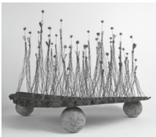
Drahtskulptur von Stefan Rüegg

Vier regionale KünstlerInnen zeigen von Auffahrt bis Pfingstmontag ihre Kreationen in der kultSCHÜÜR