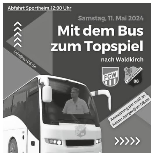
Bus zum Topspiel