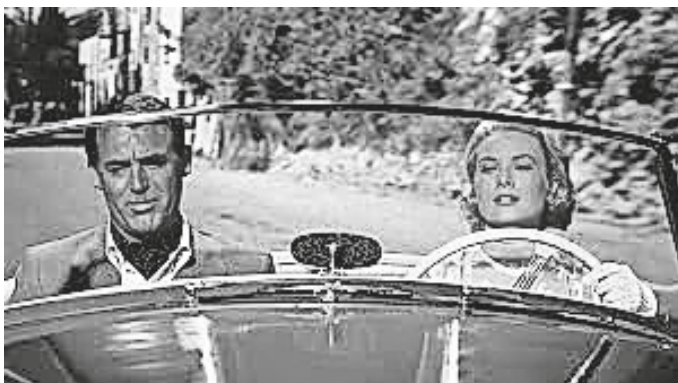
Cary Grant und Grace Kelly