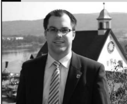
Bürgermeister-Sprechstunde Montag, 7. Mai 2012 von 18.00 bis 19.00 Uhr im "Alten Rathaus" Hochsal